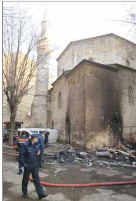
Dražavni organi su propustili da zaštite džamiju

Neposredno nakon napada, još jedno razočarenje stiglo je iz republičkog tužilaštva - za pljevinu džamija optužnica protiv određenog broja lica podignuta je zbog učestvovanja u grupi koja vrši nasilje, kao da se radi o uobičajenom nestasluđu fudbalskih navijača. Prema stavu Fonda za humanitarno pra-