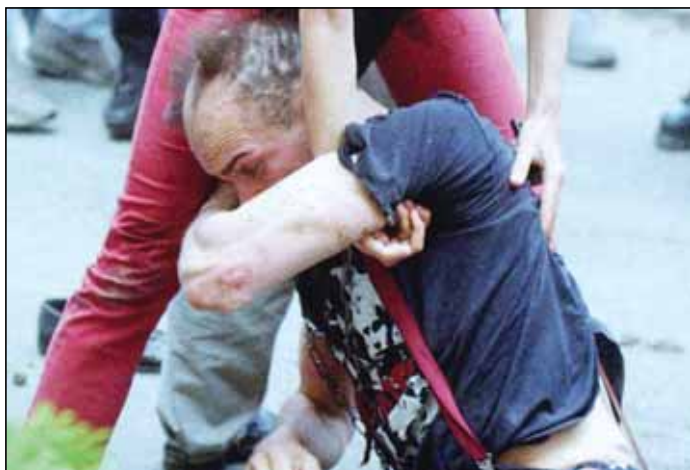
Batinjanjem protiv slobode izbora: Scena sa parade ponosa u Beogradu 2001

Međutim, ono što najviše zabrinjava jeste da četiri godine nakon uspostavljanja demokratske vlasti u Srbiji trenutno postoji samo jedan zakon koji štiti prava istopolno orijentisanih osoba - Zakon o javnom informisanju u članu 38. sadrži pravila o zabrani govora mržnje. Neophodno je u ustavni tekst uneti odredbu o istopolnoj seksualnoj orijentaciji kao jednom od Ustavom zaštićenih svojstava žena i mušaka, zabraniti diskriminaciju ne samo kada dolazi od državnih institucija, nego i kada diskriminaciju čine i druga fizička i pravna lica, a zatim formulisati i čitav korpus antidiskriminacionih zakonskih normi, počevši od krivično-pravne zaštite GLBT osoba od akata diskriminacije, pa do garantovanja prava na zasnivanje istopolnih partnerskih i porodičnih odnosa. Naravno, reakcija države morala bi da obuhvati i mere tzv. „afirmativne akcije“ radi izjednačavanja položaja GLBT osoba sa drugim pripadnicima društva.