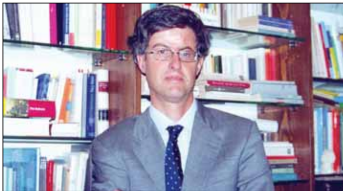
Diskriminacija je danas ozbiljno pitanje u EU: Alessandro Simoni

Objavlivanje dodatka Danas PRAVOplus posvećenog diskriminaciji, ne bi bilo moguće bez velikušne pomoći Švedskog helsinškog komiteta za ljudska prava i Fonda za otvoreno društvo. Redakcija dodatka se srdačno zahvaljuje.